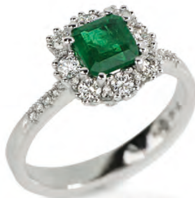
Anello con smeraldo taglio quadrato e diamanti bianchi naturali collezione Pezzi Unici

Ogni creazione è realizzata per celebrare la bellezza e l'eleganza, e per trasformare ogni occasione in un ricordo prezioso.