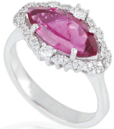
Anello in oro bianco 18 kt con tormalina rosa taglio navette e diamanti bianchi naturali collezione Pezzi Unici