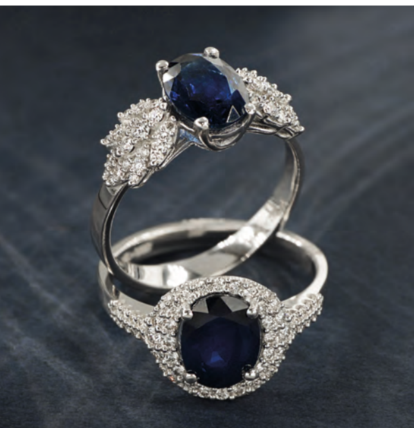
Anelli con diamanti bianchi naturali e zaffiri blu collezione Pezzi Unici