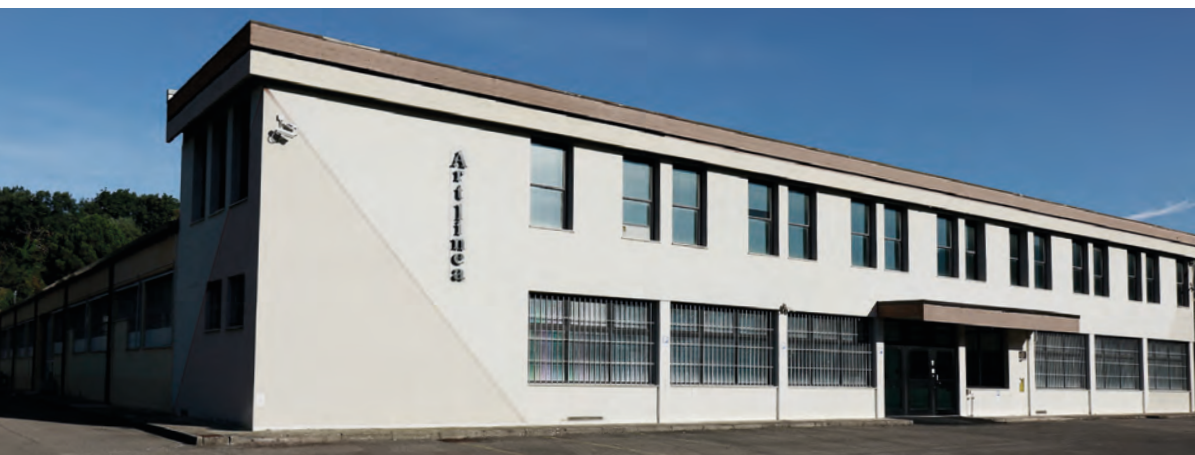
Artlinea Headquarter in Tuscany

This is possible partly due to its participation in the most important fairs of the sector, such as VicenzaOro, OroArezzo and Open at the Tari Goldsmith Center.