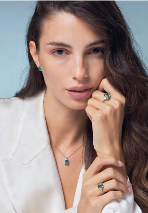
Parure in oro bianco 18 kt con smeraldi e diamanti bianchi naturali collezione Gem Passion e Pezzi Unici

Ogni montatura è studiata nei minimi dettagli dal team di designer e gioiellieri per raccontare una storia di emozioni attraverso le pietre preziose, che con i loro colori vivaci e le loro sfumature uniche, diventano le protagoniste: dai toni caldi dei rubini e delle tormaline rosa, ai freddi e misteriosi zaffiri blu e smeraldi, ogni gemma è un piccolo universo da esplorare.